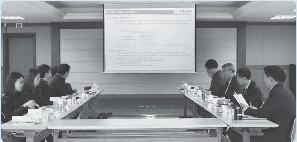
대한기계설비산업연구원은 지난 2월 20일 기계설비건설회관 대회의실에서 2017년도 제1차 연구심의위원회를 개최했다