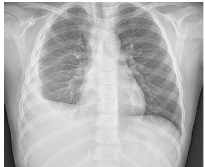
Fig. 1. Chest radiography shows right pleural effusion.

입원 1병일째부터 폐렴 미코플라스마 및 세균성 폐렴 의심 하에 항생제 치료하였고, 미열은 입원 2병일부터 호전되었으나 흉부 단순 방사선 사진에서 우측 흉막삼출 호전 양상 없었다. 제4 병일에 시행한 혈액검사에서 백혈구 11,000/mm 3 , 호중구 22.8% (2,520 \mu /L)로 감소하였고, 총 호산구는 5,730/mm 3 (43.1%), 혈청 총 IgE는 1,737 IU/mL로 증가하였다. 입원 4병일째 진단과 치료를 위하