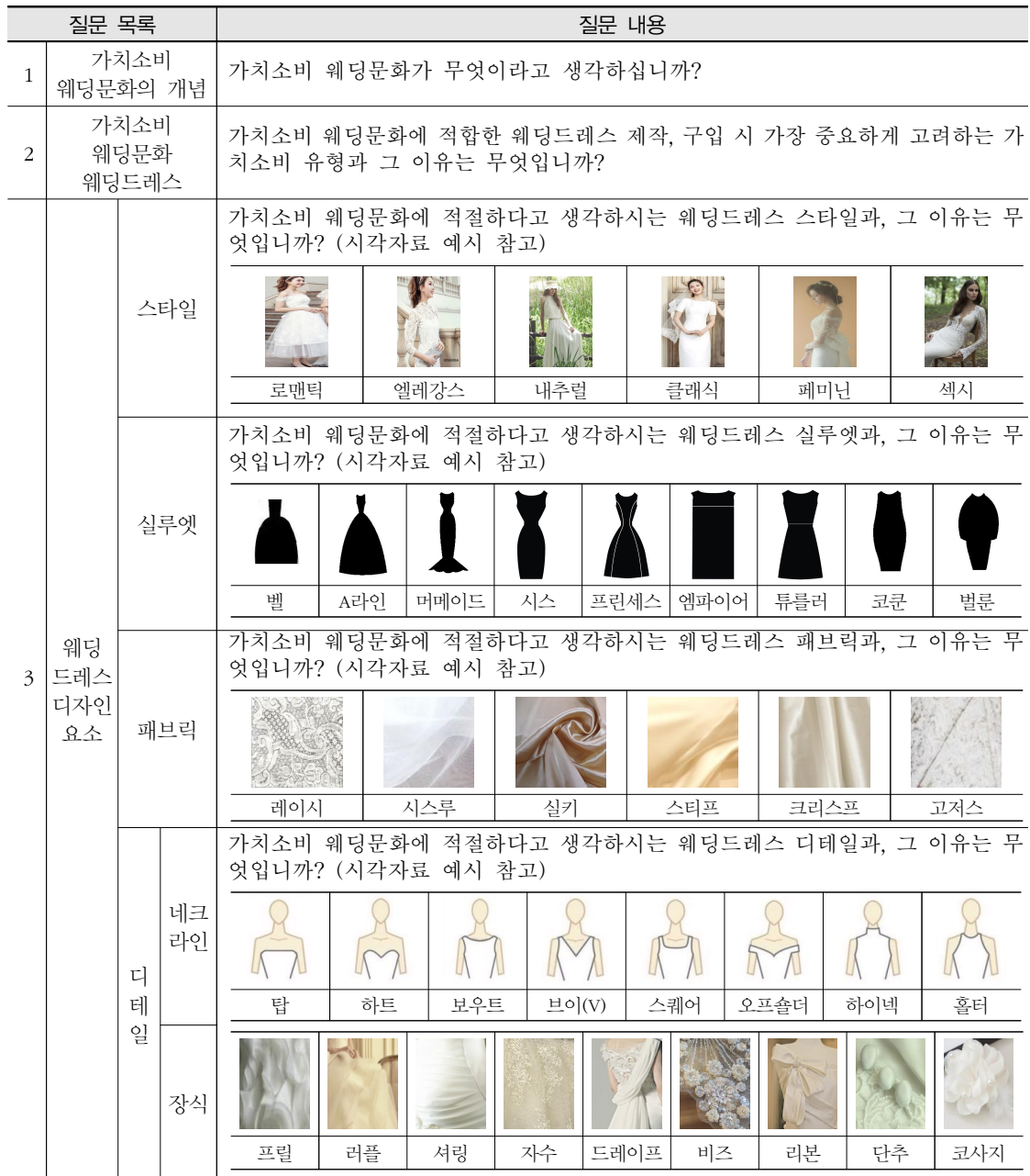
〈표 2〉 가치소비 웨딩문화와 웨딩드레스 디자인 요소 질문지 목록 및 시각자료

소비자 집단과 전문가 집단의 일대일 심층면접을 진행하였으며, 심층면접 내용의 분석은 가치소비 유형 및 특성을 중심으로 분석하였다. No.1에서 No.7는 소비자 집단이며, No.8에서 No.14는 웨딩