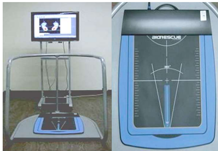
그림 2. Biorescue