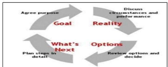
Fig. 1. GROW Coaching Model

첫째, GROW모델은 단일모형 중 가장 많이 활용되는 모델로서, ①목표설정(Goal), ②현상확인 및 현실 파악(Reality), ③대안탐색(Option) 및 전략과 행동 파악, ④구체적인 실행의지(Will) 확인의 4단계이다. 순환적이고 유동적인 특징과 함께 단순하고 적용이 용이하고 코치이의 행동에 초점을 둔 유용성을 지닌 모델로 평가받고 있다[44].