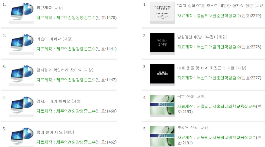
Fig. 1. List of clinical performance examination in the Korean Consortium for e-Learning in Medical Education.

필기시험은 각 학교에서 주로 강의를 비롯한 problem-based learning, team-based learning 등의 소규모그룹 토론 등을 통하여 수업에서 이루어지며, 실기시험은 술기연습과 수기문항을 통하여 익히고 있다. 이러한 수기문항과 진료문항은 각 학교마다 처한 상황에 따라 차이는 있지만, 한 학교에서 모든 문항을 개발하고 모의환자를 교육하고 관리하는 것이 매우 힘든 것이 현실이다. 시간적인 제약과 공간적인 제약이 많은 의학교육환경에서 이러한 것을 해결하