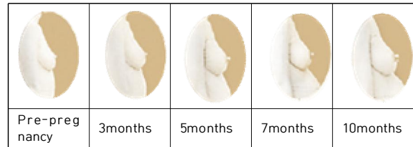
Fig. 2. Bust change of pregnant women[7]

임산부의 체형에 대한 연구로는 흉부체형에 대한 연구[8], 임신부의 전신체형에 대한 연구[9][3][10], 임신부용 브라지어와 거들에 대한 연구[8][11]가 있으나 임신부의 특성상 연구가 미미한 실정이며, 최근에 이루어진 연구는 부족하다. 그리고 기존의 연구들은 임신부의 실제 신체계측치를 활용한 연구들이 대부분이며, 임신부 자신이 체형에 대해서 어떻게 인식하고 있는지를 유형화한 연구는 부족한 실정이다. 따라서 본 연구에서는 현재 임신 중인 임신부 중 6개월 이상의 임신부를 대상으로 스스로가 본인의 체형을 어떻게 인식하고 있는가 하는 주관적 평가를 유형화하고 유형별 특성을 고찰하고자 한다. 이를 통해 임신부의 체형에 적합한 의복 디자인 및 패턴설계에 필요한 기초자료를 제공하고자 한다.