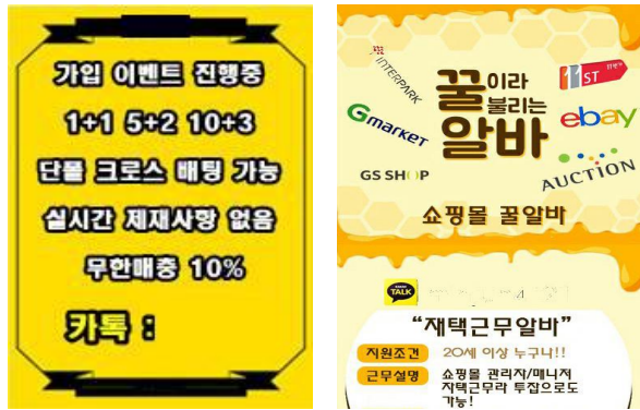
(a) Gambling ads Image (b) ads Image

여기서 차단 판정을 받으면 해당 이미지를 게재할 수 없도록 차단하고, 경고 판정을 받으면 이미지를 게재할 때 경고 메시지를 출력하도록 한다. 그리고 통과 판정을 받으면 이미지를 게재할 수 있도록 한다.