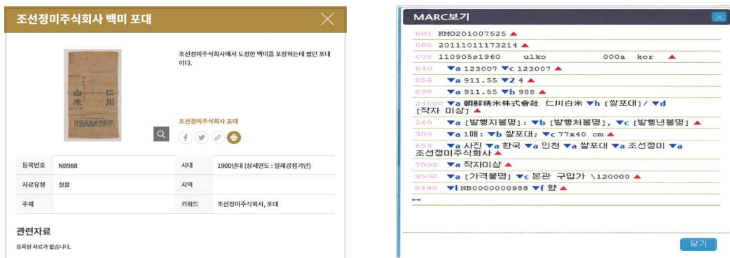
〈그림 2〉 「향토·개항자료관」의 검색결과 화면(좌)-MARC(우)

수집된 자료에 대한 관리는 별도의 기술규칙을 제정하지 않고 기존의 도서관 자료 관리시스템을 통해 KORMARC-통합서지용에 맞춰 등록관리 하고 있다. KORMARC-통합서지용 적용을 위해 개별 자료는 자료의 유형에 대해 고정장 필드인 리더 부분에서 ‘06(레코드 유형)’의 구분부호에 의해 적용하여 기술하고 있으며, 일반적인 기술사항은 가별길이필드의 제어필드와 데이터필드에서 해당하는 필드에 적용하여 기술하고 있다.