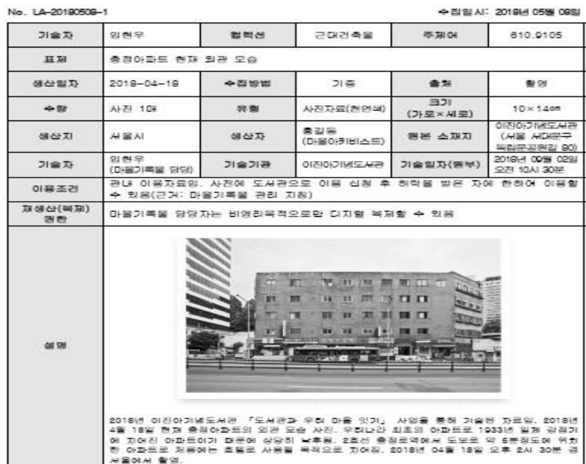
<그림 4> 마을기록물 기술사례(사진자료)

한편, 마을기록물 관리를 위한 기술영역 및 기술요소에 따라 매핑된 KORMARC-통합서지용 데이터필드를 실제 적용한 마을기록물 기술 사례는 다음의 <그림 4>와 <그림 5>과 같다. 사례에서는 마을기록물 중 사진자료에 대한 마을기록물 기술에 대하여 KORMARC-통합서지용 데이터필드에 적용해 기술하였으며, 해당 마을기록물의 주요한 특성인 이용제한 사항과 마을기록물 설명 그리고 복제에 관한 사항 등에 대하여 506, 520, 540 등의 필드로 적용하여 기술할 수 있다.