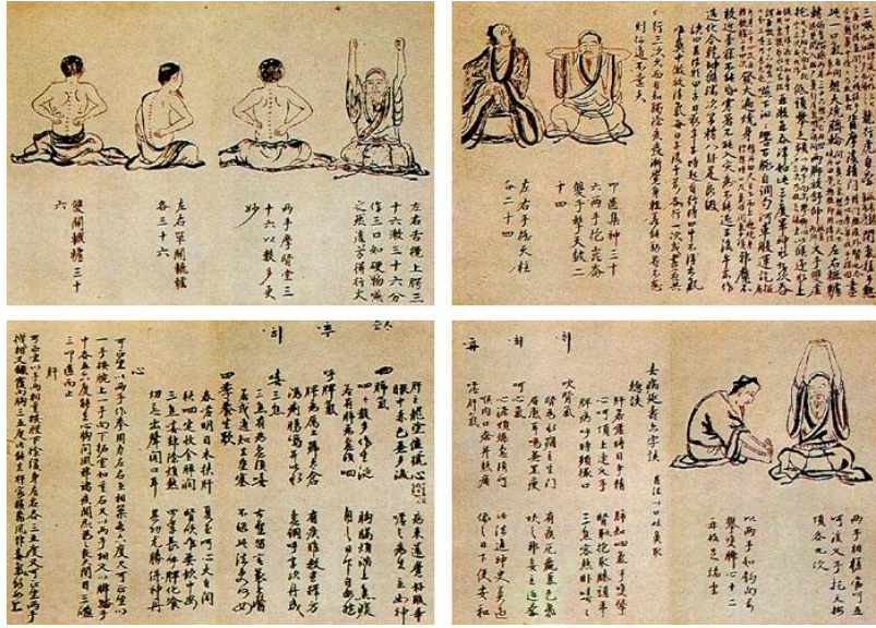
Fig. 3. Treasure no. 548-2 calligraphy by Yi Hwang The 18th Album Hwalinsimbang Doinbeop.