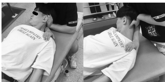
그림 4. H/R method