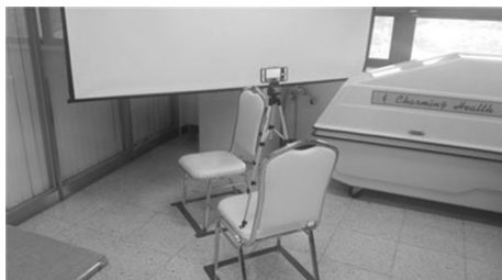
그림 1. 삼각대와 카메라