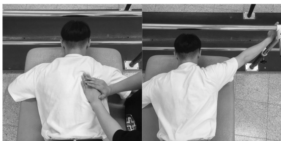
그림 3. PSAEx method