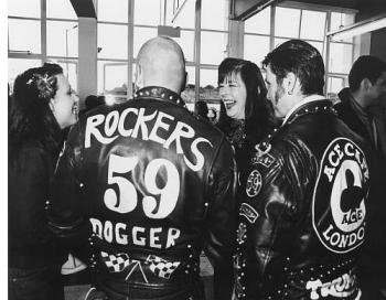
〈그림 11〉 1950년대 영국의 테디보이 스타일

(출처: http://www.thierylegoues.com/portfolio/fashion-location-teddy-boys )