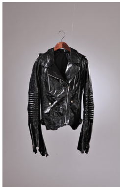
〈그림 12〉 패션디자인 제안 2