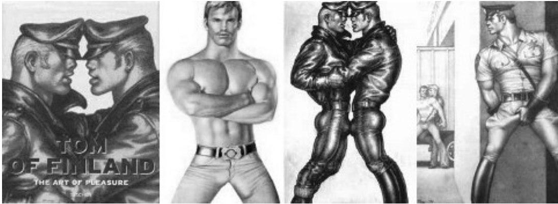
〈그림 13〉 탐 오브 핀란드