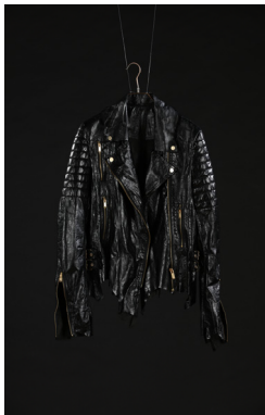
〈그림 11〉 패션디자인 제안 1