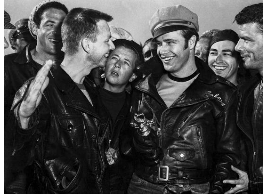
〈그림 4〉 영화 더 와일드 원