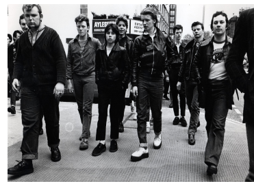
〈그림 12〉 1970년대 영국의 테디보이 스타일