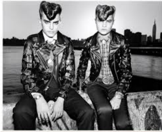
〈그림 10〉 Vogue 테디보이-룩 화보