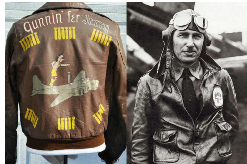
<그림 2> A-2 플라이트 재킷