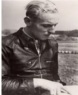
〈그림 8〉 WW2 독일공군 조종사 Hartmann과 플라이트 재킷 착용 사진