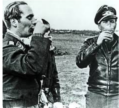
〈그림 9〉 WW2 독일공군 Luftwaffe Air Crew 플라이트 재킷