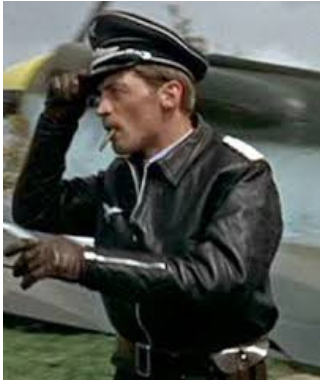
〈그림 7〉 WW2 독일공군 Luftwaffe Air Crew 플라이트 재킷1