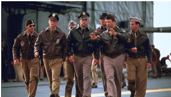
<그림 1> 영화 진주만의 한 장면

‘말론 브란도’ 주연의 영화 ‘더 와일드 원(The Wild One)’에서 그가 착용했던 라이더 재킷은 당시 미국의 시대 상황과 맞물려 미국 청년들의 반항을 상징하는 대표적인 패션 아이콘으로 자리 잡을 수 있는 결정적인 계기가 되었다. 이전에도 이미 바이커들이 입으면서 부정적인 이미지를 가지고 있던 라이더 재킷은 이 영화를 계기로 더 확실하게 부정적이고 반사회적인 청년 하위문화의 상징으로 자리 잡았다(양미경, 2003). 군인들의 유니폼에서 시작된 라이더 재킷은 전쟁이 끝나고 바이커들을 비롯해서 일반 대중들이 일상복으로 입기 시작하면서 많은 디자인의 변화와 함께 명칭도 라이더 재킷으로 완전히 자리 잡게 됐다. 현재, 라이더 재킷은 전 세계적으로 사랑받는 가장 대중적인 패션 아이템의 하나로 자리 잡았으며, 파리, 밀란, 런던, 뉴욕 컬렉션과 같은 세계적인 패션쇼에도 매 시즌 등장하고 있다. 이는 라이더 재킷이 가지고 있는 독특한 매력이 대중들의 감성에 부합하기 때문일 것이다. 군복에서 시작됐지만, 시대적인 상황과 맞물려 반사회적인 성향을 보이는 청년들의 대표 스타일로 인식되었던 라이더 재킷은 많은 디자이너에 의해 새로운 스타일로 끊임없이 재창조되어 패션 트렌드의 중요한 스타일링 아이템으로 주목받아 왔지만, 이와 관련된 연구는 청년문화 혹은 하위문화에 관한 연구