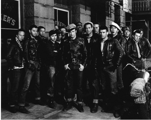
〈그림 3〉 영화 더 와일드 원