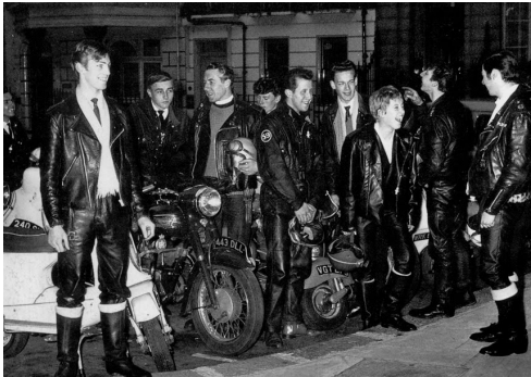
〈그림 5〉 1950년대 영국 바이커 스타일