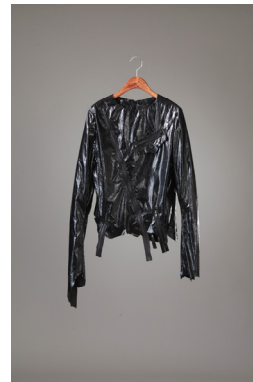
〈그림 14〉 패션디자인 제안 4

깃(Collar), 소매, 몸판 등의 의상의 전체 끝단(段) 부분의 마감을 봉제로 처리하지 않고, 원(元) 소재 상태 그대로 두었다.