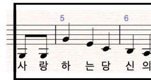
그림 2. ‘생일 축하’ 노래의 데이터 수집 구간(세 번째 프레이즈) Figure 2. Recorded third phrase of the ‘Happy Birthday’

노래 데이터 수집에 사용된 노래는 ‘생일 축하’이다. 이 곡은 선행연구에서 사용되어 CI 아동의 선율재인정확도 중 초등학생 CI 대상 100%로 선정된 곡들 중 하나이며(Oh, 2015), 선율 산출 정확도를 측정할 때 중재 후 음정산출의 효과성이 검증되었다(Kim & Chong, 2017). ‘생일축하’ 노래에서는 상행과 하행 패턴과 도약과 순차 진행이 모두 포함된 세 번째(phrase) 프레이즈 구간을 데이터로 수집하였으며, 악보는 아래의 그림 2와 같다.