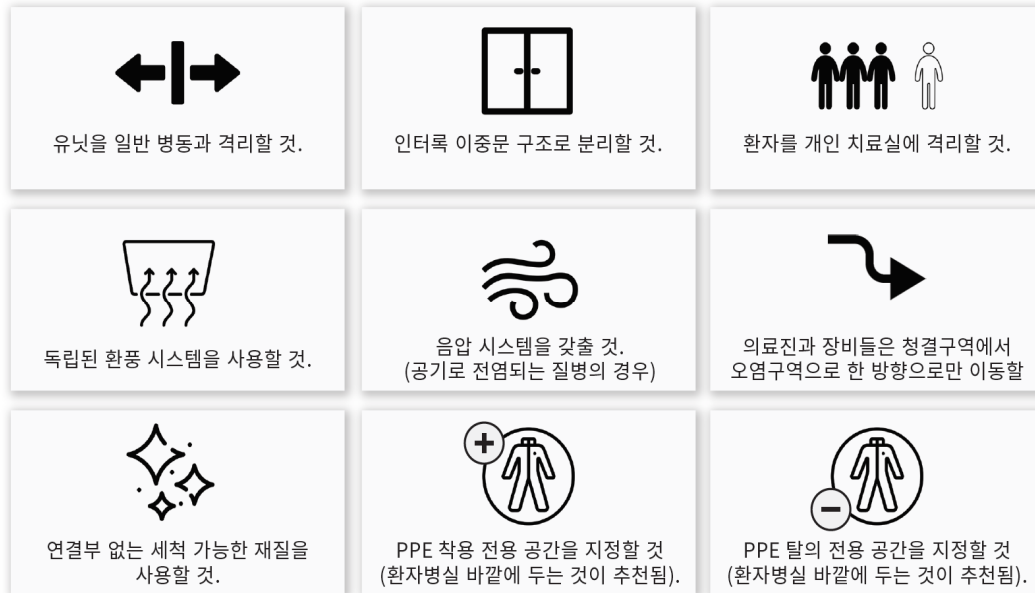
[그림 1] BCU 설계 시 일반적인 고려사항 (Design Strategies for Biocontainment Units: Creating Safer Environments. Matic, Humphreys, & DuBose, 2020, p.2)

에볼라 바이러스는 직접 접촉이나 감염된 사람의 체액 접촉, 오염된 표면이나 도구(예: 의료장비)를 통한 간접 접촉을 통해 인간 대 인간으로 전염이 이루어진다. 2) PPE 탈의는 의료진의 맨 피부에 오염된 장비가 닿지 않도록 조심하며 진행해야하기 때문에 고위험 활동으로 간주된다. 의료진이 장시간의 환자 대면 후 지친 상태에서 이 과정을 진행하는 것은 특히 어려울 수 있으며, 이는 의료진의 실수나 위험 행동, 그리고 고위험 병원체 접촉까지 이어질 수 있다. 3)