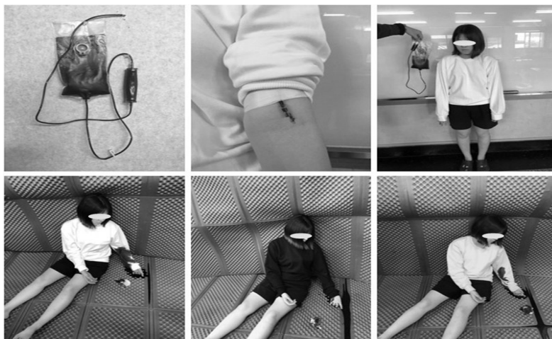
Fig. 1. Fake-bleeding method and bleeding patient simulation environment

실험은 21세의 여성 연구자를 이용해 출혈 시뮬레이션 환자를 담당하게 하였다. 모의 환자는 정해진 시간, 동일 환경에서 세 가지 색상(흰색, 노랑, 검정)의 맨투맨 상의와 검정색 반바지를 착용하게 하였다. 신발을 신지 않은 상태에서 동일한 blemish balm(BB) 제품을 이용해 창백한 얼굴로 분장하였다. 또한, 의복의 내측과 왼쪽 팔 팔꿈치 안쪽 부위에 미리 준비된 600mL의 혈액 분출 팩을 설치하고, 의복 내부에서 자연스럽게 600mL의 모의 출혈이 발생하도록 한 뒤 약에 취해 정신을 잃고 쓰러진 상태를 연기하였다(Fig. 1). 연구자는 혈액분출 팩의 모조혈액 600mL가