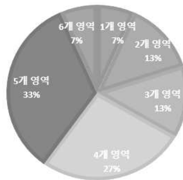
<그림 2> 도서 주제영역별 동아리 수

응답이 70%를 상회하였다. 그러나 <그림 2>에서와 같이 실제 선정된 도서의 주제분야를 조사한 결과, KDC 10개 분야 중 5개 분야의 도서를 활용한 동아리가 33%였으며, 4개 분야의 도서를 활용한 동아리가 27%로 나타나 절반 이상의 동아리가 4~5개 분야의 자료를 제한적으로 활용하였다. 특히, 종교, 자연과학, 예술, 언어 4개의 분야는 1~2개 동아리에서만 선정함으로써 독서동아리에서 잘 다루지지 않는 영역이 존재함을 알 수 있었다 4) .