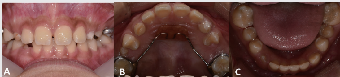
Fig. 5. After 10 months, Intraoral photograph. #15, 24, 35 were erupted and lower lingual arch was removed.

치아는 없었으나 구치부 개방교합의 정도는 많이 개선되었다(Fig 4A-C). 파노라마 상, 초진과 비교하였을 때 하악 소구치에서 맹출이 많이 진행되었고, 상대적으로 상악 소구치의 맹출 속도는 더디나 치아의 이동은 관찰되고 있다(Fig. 4D). 10개월 뒤, #25를 제외한 모든 치아 출은하였으며 설측 호선은 제거하였다(Fig. 5). 환아는 계속 관찰 중에 있으며, 저작 기능 향상과 치아의 양호한 맹출을 보이고 있다.