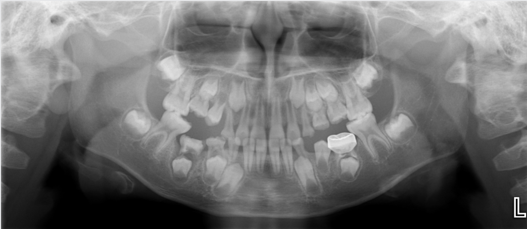
Fig. 2. Initial panoramic radiograph. The permanent successor of primary molars was present.