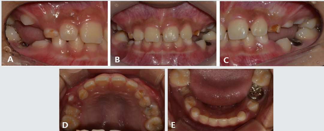
Fig. 1. Initial intraoral photograph. Infraocclusion was observed in the first and second primary molars.