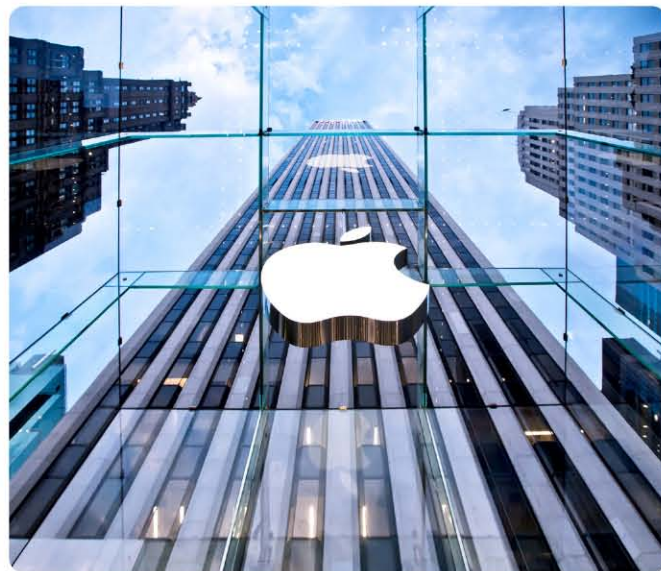
거대한 20세기 건축물과 대비되는 투명한 glass cube

건축법에서 재축(再築)이란 “건축물이 천재지변이나 그 밖의 재해(災害)로 멸실된 경우 그 대지에 다시 축조하는 것을 말한다”라고 정의하고 있습니다. 필자는 신축, 재개발, 재건축 등 새로 짓는 것이 건축의 주류인 상황에서 재축된 건축물들을 소개하고 건축의 의미를 돌아보고자 이 연재를 준비했습니다.