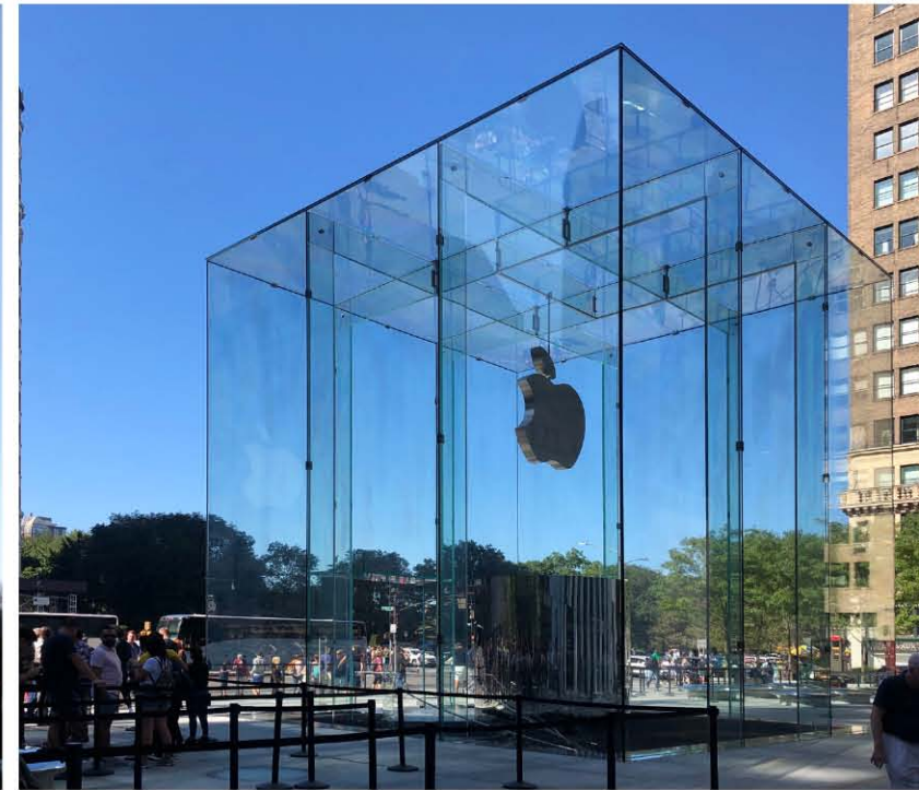
15장의 유리로 2011년에 만들어진 두 번째 glass cube

당시 트위터 등 SNS는 이 사고소식을 전했고, 그중 일부 네티즌의 글에서 깨진 유리가 아름다운 작품 같다는 반응도 있었다. 이런 반응을 이해하려면 강화유리의 깨짐 특성을 먼저 이해해야 한다. 강화유리는 일반 유리와 깨지는 형상이 다르다. 일반 유리는 충격지점에서 방사형으로 갈라지며 길게 깨진다. 반면 강화유리는 깨질 정도의 충격을 받으면 표면장력이 파괴되면서 충격지점과 상관없이 유리판 전체가 작은 조각으로 산산이 깨진다. 교통사고가 났을 때 자동차 유리가 파손되는 모습과 비슷하다. 다행스럽게도 glass cube의 유리는 필름이 붙은 강화유리(laminated tempered glass)였다. 그래서 3m × 9m의 대형 유리가 깨졌지만, 깨진 조각들은 필름에 붙어있었고, 형태를 그대로 유지할 수 있었다. 그래서 다친 사람이 없었고, 행인들은 깨진 유리를 아름다운 작품으로