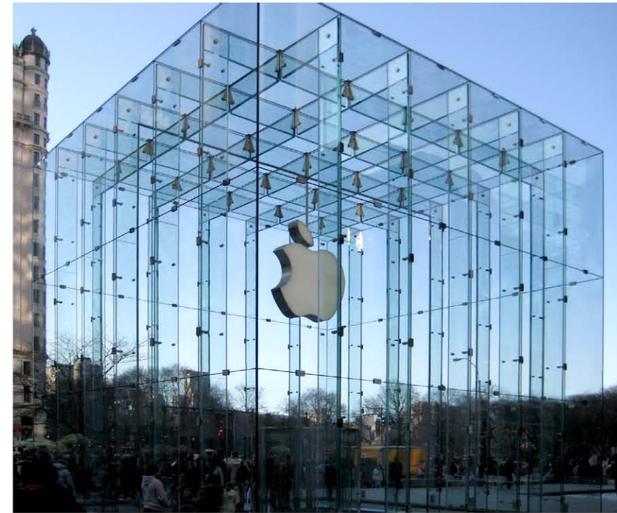
90장의 유리로 2006년에 만들어진 첫 번째 glass cube

apple 5th avenue glass cube는 가로 × 세로 × 높이가 각각 9m인 투명한 정육면체다. 건축물로는 작은 크기지만, 주변의 대형건축물들과 대비되어 특별해 보인다. 폭 3m, 높이 9m의 대형 유리 15장으로 만들어진 작지만 투명한 이 건축물은 「애플」을 상징하며, 인접한 20세기 건축물들과 겨루기라도 할 기세로 서 있다. 골리앗에 맞서는 다윗처럼 작지만 당당하다.