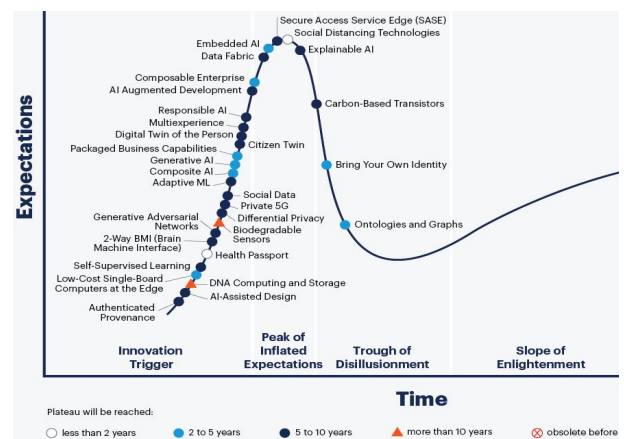
Fig. 1. Hype Cycle for Emerging Technologies 2020 [7]

가트너의 2020년 트렌드에 관해 Fig 1[7]처럼 Hype Cycle을 통해 살펴보면 곡선 내 위치하고 있는 다양한 AI 기술과 응용 서비스들의 대부분이 5년 이내에 시장에서 타 산업과의 융합 기술로 활용될 수 있는 생산 안정기 (Plateau of Productivity)에 안착할 것으로 보고 있어 많은 기업과 정부에서 인공지능을 활용한 경제적 이익 확보와 기술 선점에 노력하고 있다.