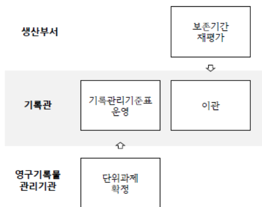
<그림 1> 평가 이전 프로세스

앞서 3.1에서 제시한 고려사항을 토대로 기록관에서의 장기보존기록물 평가업무 프로세스를 제안하였다. 프로세스는 업무시점과 유형에 따라 두 가지로 구분하였다. 기록관리기준표 운영이나 이관 등을 중심으로 한 ‘평가 이전 프로세스’와 실제 평가업무를 중심으로 한 ‘평가 프로세스’로 분리하였다. 평가란 단편적인 업무가 아닌 생산, 정리에서부터 이어져 기록관리 프로세스 전반에 걸쳐 진행되는 업무이기 때문이다.