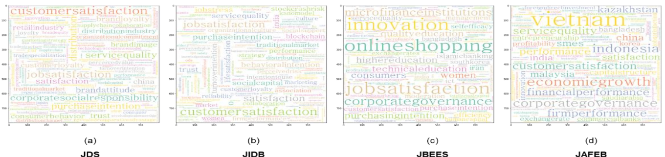
Figure 2: Results of Word Clouding

빈도분석 분석결과는 다음과 같다. JDS는 고객만족, 직무만족, 기업의 사회적 책임, 서비스품질, 유통과 같은 키워드의 빈도가 높은 것으로 나타나 학술지의 목적에 부합하는 결과물이 출판되는 것으로 보인다. JIDB도 JDS와 유사하게 고객만족, 직무만족, 만족, 구매의도, 행동의도의 빈도가 높게 나타났으며, JBEES는 소액 금융기관, 혁신, 온라인쇼핑몰, 기업지배구조 등의 빈도가 높아 비즈니스 및 경제 연구에 대한 목적이 적절하게 반영되고 있는 것으로 판단할 수 있다. JAFEB는 최근 아시아 및 중동을 중심으로 금융, 경제 및 경영관리 문제를 다루는 특성상 베트남, 경제성장, 인도네시아, 기업지배구조, 서비스품질과 같은 키워드의 빈도가 높은 것으로 확인되었다. <Figure 2>에는 워드클라우드링 결과를 제시하였다.