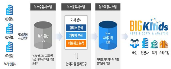
Fig. 1. BIGKinds Service configuration

빅카인즈 서비스의 구성도는 다음 Fig. 1[12]과 같이 뉴스 수집 시스템, 뉴스 분석 시스템, 저장 시스템으로 구성된다.