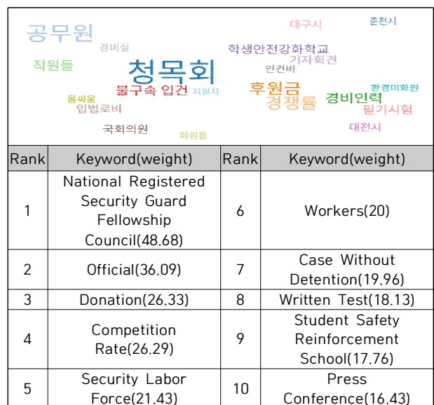
Table 5. Related Word Analysis(2010s)

청원경찰에 대한 연관어 분석 결과는 다음과 같이 나타났다. 2010년부터 2019년까지의 키워드 가중치 분석 결과 청원경찰의 관련 사건, 채용에 대한 키워드가 도출되었다. 가중치 순서대로 살펴보면 청목회(48.68), 공무원(36.09), 후원금(26.33), 경쟁률(26.29), 경비인력(21.43), 직원들 (20), 불구속 입건(19.96), 필기시험(18.13), 학생안전강화 학교(17.76), 기자회견(16.43)으로 나타났다.