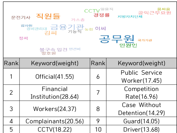
Table 4. Related Word Analysis(2000s)

되었다. 가중치 순서대로 살펴보면 공무원(41.55), 금융기관(28.64), 직원들(24.37), 민원인들(20.56), CCTV(18.22), 공익근무요원(17.45), 경쟁률(16.96), 불구속 입건(14.29), 방호원(14.05), 운전기사(13.68)으로 나타났다.