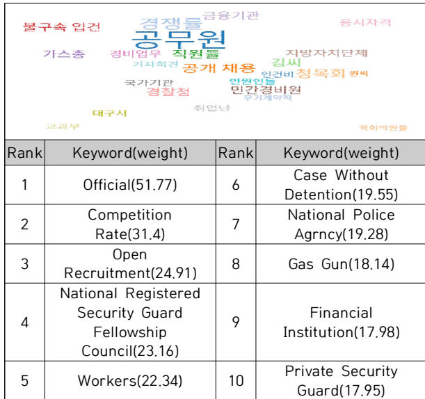
Table 2. Related Word Analysis(all)