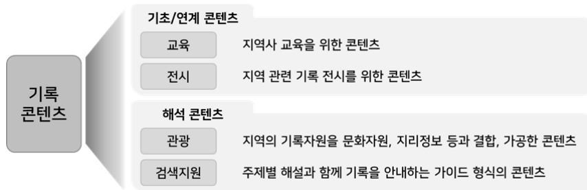
<그림 1> 기록콘텐츠의 구분(설문원(2012) 재구성)

연계콘텐츠에 대한 해석 및 서술정보를 포함한 해석콘텐츠로 구분할 수 있다(설문원, 김익한, 2006, 123). 설문원(2012)은 로컬리티 측면에서 개발될 수 있는 기록콘텐츠에 대해 다음과 같이 제시한 바 있다. 교육 및 전시콘텐츠의 경우 기초콘텐츠 또는 연계콘텐츠로, 관광 및 검색지원콘텐츠는 아카이브의 해석이 필수적인 해석콘텐츠로 볼 수 있다. 이를 재구성하면 <그림 1>과 같다.