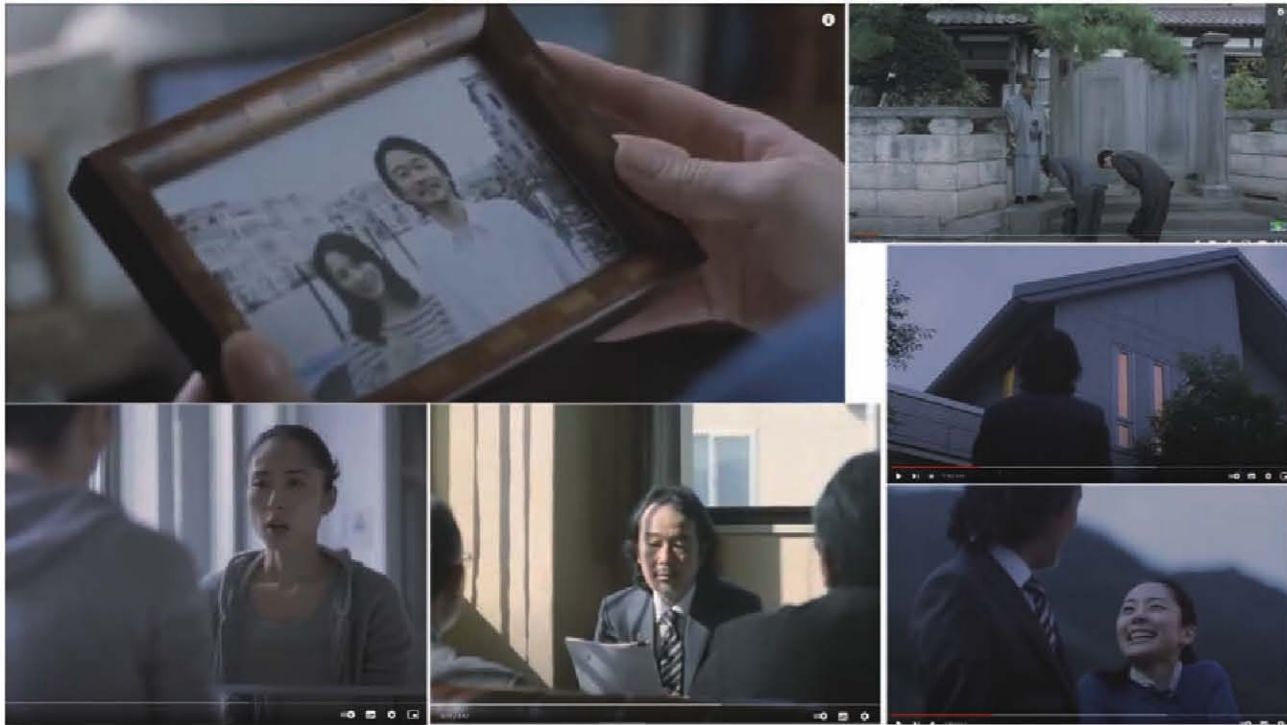
다이와하우스 공업_기업PR:여기서, 함께 편_TVCM_2011

남편) 나는 간단히 머리 조아리는 남자가 아니야. 아내) 자기 편할 때만 남자 핑계를 대지. 남편) 역시 억지인가? 아내) 젊었을 땐 좀 더... (젊을 때 사진을 보며) 젊을 때부터 별 거 없었네. 아내) 나이 먹어도 소중히 대해 줘. 남편) 좋아. 아내) 차버릴지도 몰라. 남편) 대신 나보다 오래 살아. 자막) 여기서, 함께. 다이와하우스