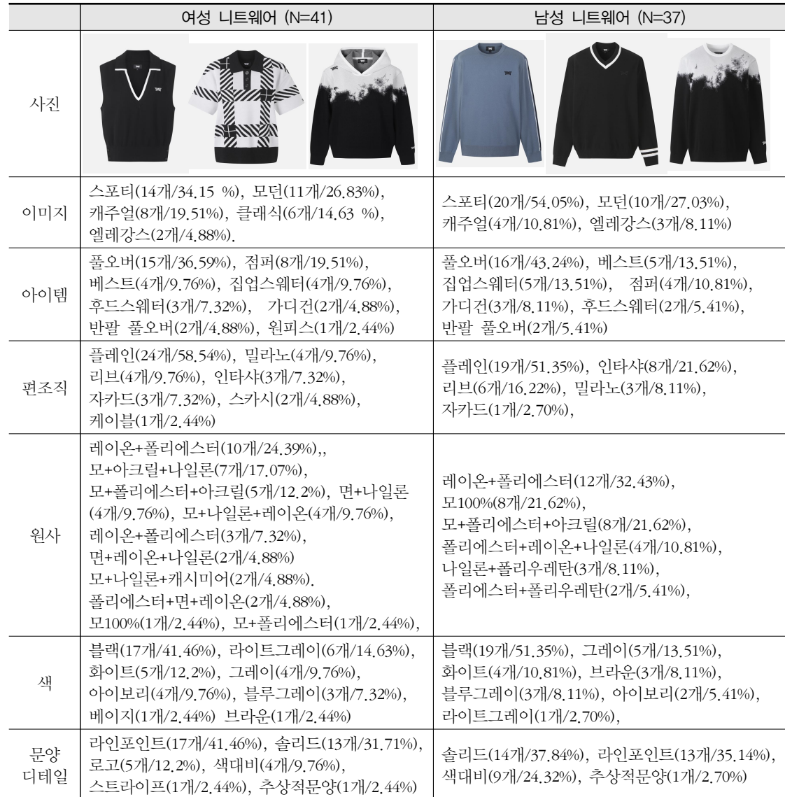
〈표 2〉 PXG 니트골프웨어 분석