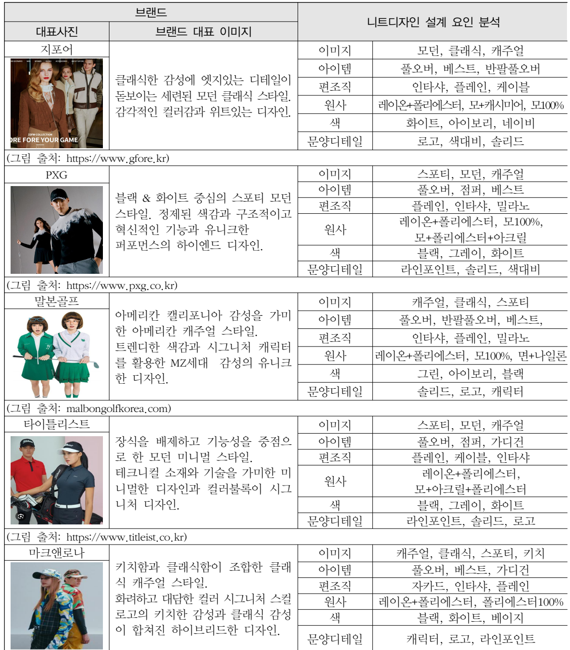
〈표 6〉 골프웨어 브랜드 이미지에 따른 니트디자인 설계 요인 분석

말본골프 브랜드의 주요한 아이덴티티인데 로고와 캐릭터 문양이 많이 사용된 것으로 입증되었다. 니트에서 로고와 캐릭터 표현이 용이한 인