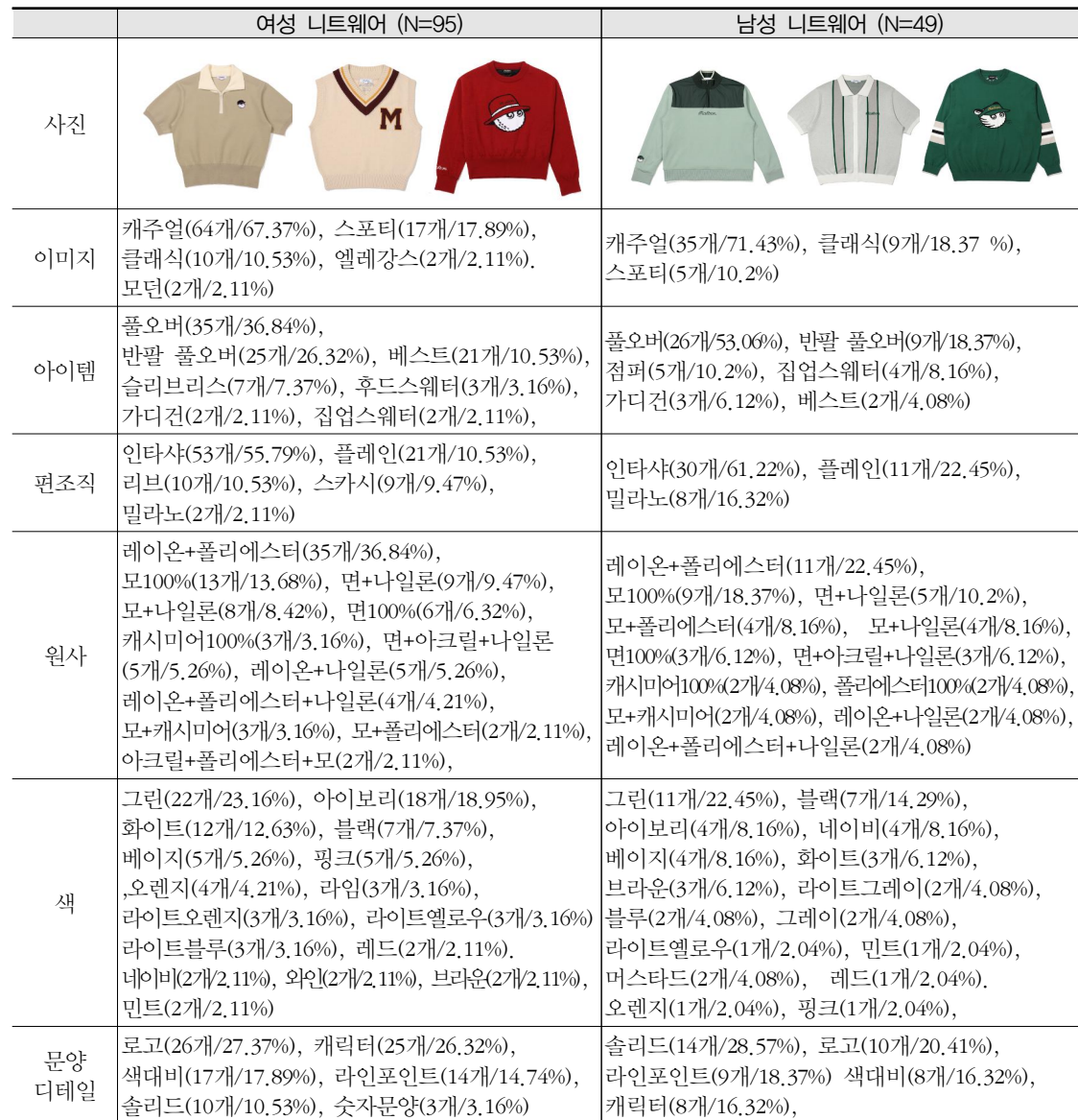
〈표 3〉 말본골프 니트골프웨어 분석

색상의 경우 그린 컬러가 각각 23.16%, 22.45%로 매우 높은 비중을 차지하는 것으로 나타났다. 그 뒤로는 일반적으로 아이보리, 블랙, 화이트, 베이지 등의 순위를 보이는 것으로 보아 그린 컬러는 말본골프를 대표하는 컬러로 보여진다. 그밖에