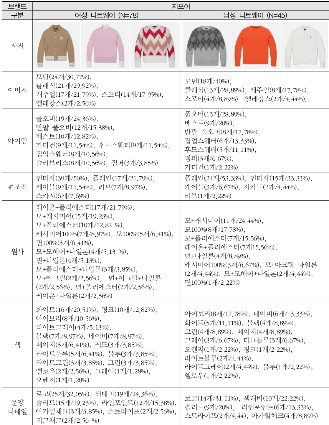
〈표 1〉 지포어 니트골프웨어 분석