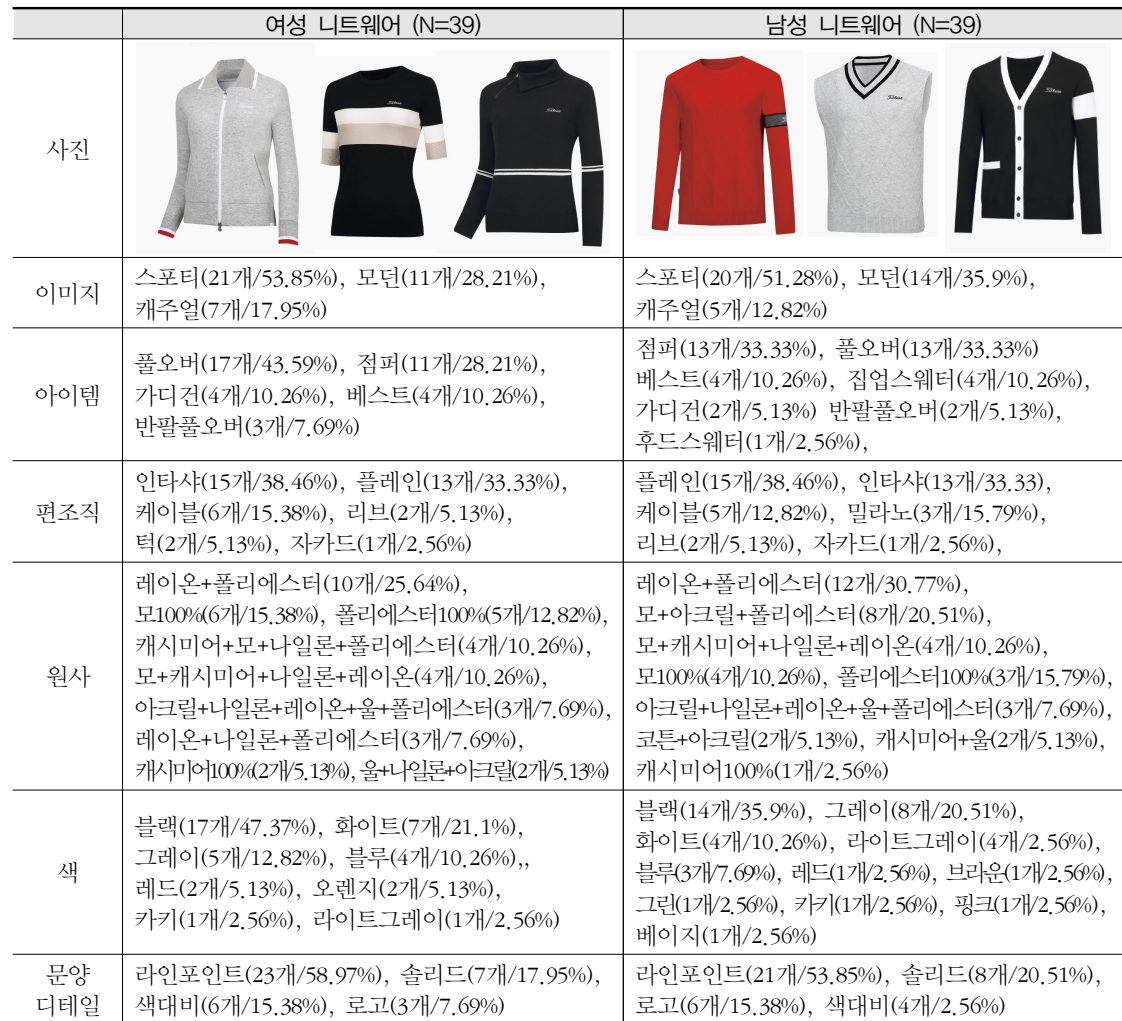
<표 4> 타이틀리스트 니트골프웨어 분석

이미지 항목에서는 여성, 남성웨어 모두 스포티가 각각 53.85%, 51.28%로 압도적인 빈도수를 보이고 있으며, 다음으로는 모던, 캐주얼 이미지 순으로 나타났다.