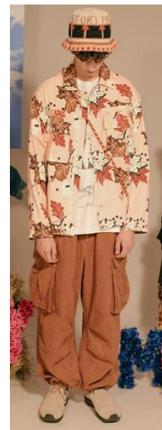
<그림 20> Story MFG 2020 F/W