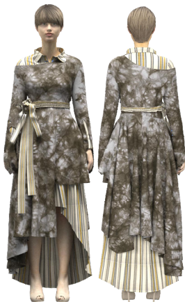
<그림 26> 3D 가상착의 작품 6