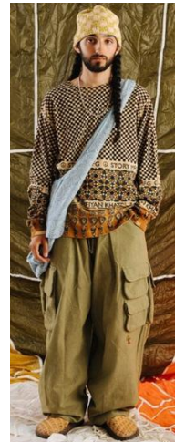
〈그림 4〉 Story MFG 2022 S/S

키워드 설정한 뒤 1차적 이미지 분석을 통해 미흡하게 등장하였던 저항성과 역사성 그리고 여성성은 제외되고 〈표 2〉와 같이 분류하였다. 전문가 집단의 이미지 분석 결과를 보면, 보디와 스토리 엠에프지에서 드러난 히피 패션의 표현 특성은 복고성, 수공예성, 이국성, 유희성, 자연성의 순으로 나타났다.