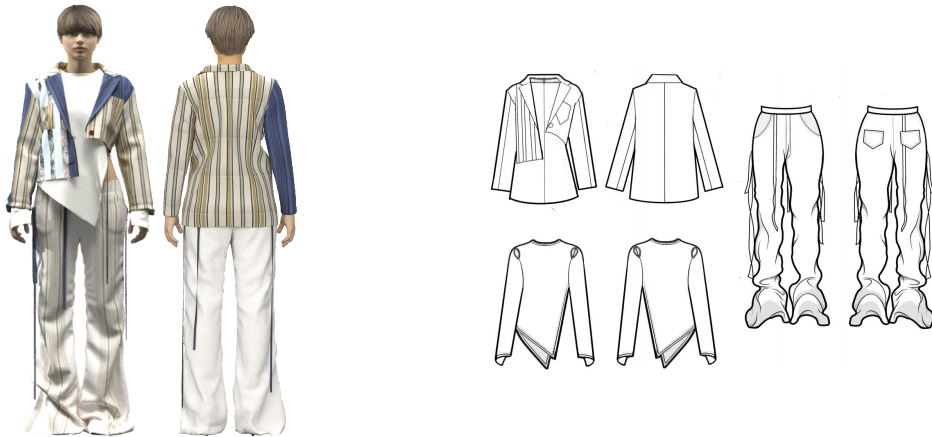
<그림 21> 3D 가상착의 작품 1

작품 1은 보디의 복고적 특성에서 나타난 대표적인 디자인 특징이자 자유와 혁명을 상징하는 스트라이프 문양을 전체적으로 배치함으로써 다양한 개성과 자유를 추구하는 히피의 정신을 강조하였다. 또한 보디의 자연성에서 드러난 꽃문양을 세로 방향으로 일부 삽입하여 마치 스트라이프와 같은 형태를 보이도록 하였으며 자유롭게 늘어져 있는 끈과 불규칙한 형태의 와이드 팬츠를 통해 자유로운 히피의 모습을 표현하였다. 비대칭한 실루엣을 통해 전통과 기성세대의 체계에 대한 거부에서 시작되