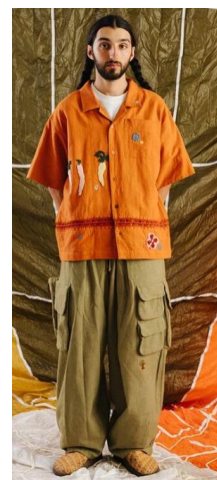
〈그림 16〉 Story MFG 2022 S/S