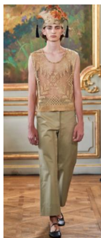
〈그림 14〉 Bode 2020 S/S