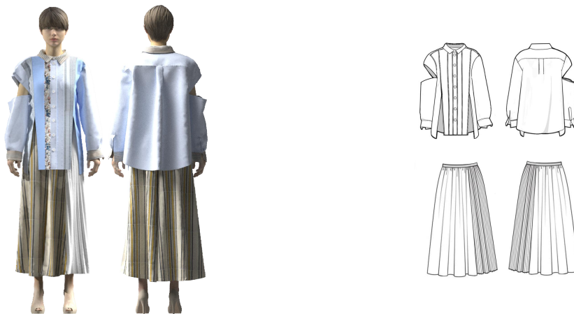
<그림 22> 3D 가상착의 작품 2