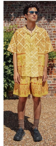
〈그림 11〉 Story MFG 2021 S/S