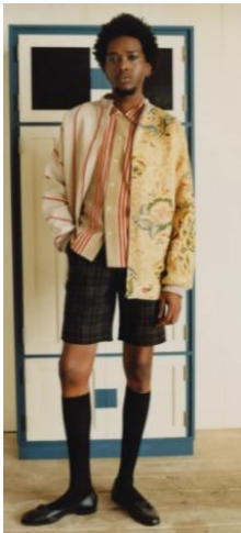
〈그림 1〉 Bode 2018 S/S