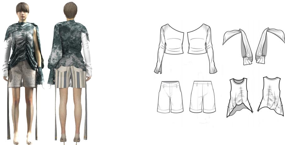
<그림 24> 3D 가상착의 작품 4