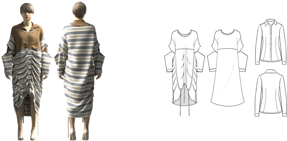
<그림 23> 3D 가상착의 작품 3

작품 3은 와이드한 원피스에 스트링을 삽입하고 물성을 조절하여 불규칙하고 추상적인 주름이 잡히도록 의도하여 전통적인 몸의 형태를 과장하고 파괴한 롱 원피스를 제작하였다. 원피스 상단에 짙은 갈색의 울 100% 원단을 단색으로 배치하였으며 소매의 양옆을 절개하여 스트라이프 문양 사이로 셔츠의 색감이 보이도록 의도하여 울동감 있는 디자인을 제안하였다. 문양을 변형하여 상대적으로 굵은 스트라이프를 사용하여 변화를 주었으며 원피스 하단에 비대칭적으로 늘어진 끈을 통해 자연스러운 느낌을 부여하였다.