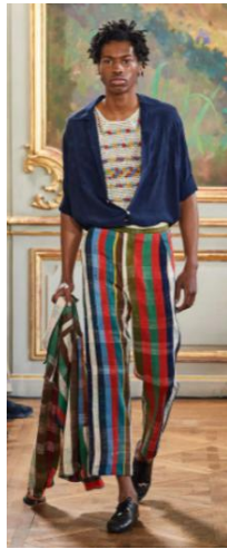
〈그림 10〉 Bode 2020 S/S