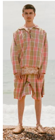
〈그림 3〉 Story MFG 2020 S/S