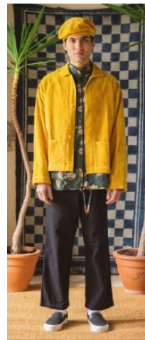
<그림 19> Story MFG 2018 F/W