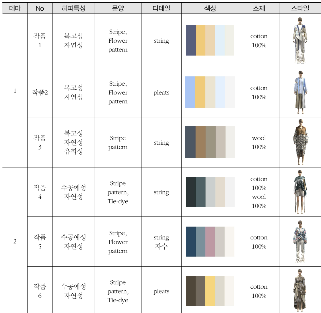
〈표 4〉 3D 디지털 패션 디자인 작품 계획

로 쟁취하는 데 의미를 두는 현대사회에 대한 저항의 내용을 가진 영화이다( http://www.cine21.com ). 테마 1의 작품들은 히피의 정신을 무한한 평행선에 담아 복고풍 스트라이프의 형태로 반복하여 시각화하였고, 꽃문양을 스트라이프와 같은 형태로 배치하여 자연을 사랑하는 히피들이 걸어가는 무한한 여정을 표현하고자 했다. 컬러는 갈색의 난색계열과 부드러운 톤의 하늘색 색상을 활용하였다. 소재는 전체적으로 자연친화적인 100% 면과 울 천연소재를 사용하였다.