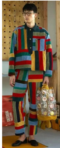
〈그림 6〉 Bode 2019 F/W