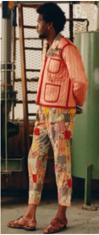
〈그림 5〉 Bode 2019 S/S