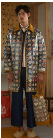
〈그림 13〉 Bode 2019 F/W