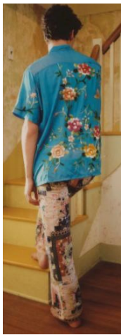
<그림 17> Bode 2019 S/S