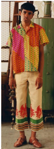
〈그림 9〉 Bode 2019 S/S