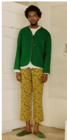
<그림 18> Bode 2019 F/W