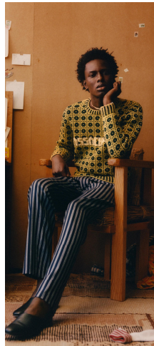
〈그림 2〉 Bode 2021 F/W