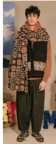
〈그림 7〉 Story MFG 2020 F/W