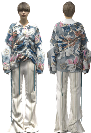
<그림 25> 3D 가상착의 작품 5