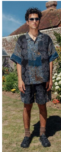
〈그림 12〉 Story MFG 2021 S/S

장인에 의해 각각 조각된 핸드메이드 패치워크 재킷과 하의를 선보이며 수공예적인 컬렉션을 구성하였다(그림 5). 2019년 F/W 시즌에는 미술사 학자 알든의 청소년기에 영감을 받아 빨강, 초록, 파랑, 노랑의 밝은 스와치를 사용한 풍부한 색감의 핸드메이드 패치워크 셔츠와 팬츠 세트를 소개했다(그림 6). 수공예성은 스토리 엠에프지에서 가장 많이 나타난 디자인 특성으로, 전통 타이다이 기법과 수공예적인 자수 기법을 더하여 오리