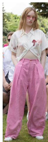
〈그림 15〉 Story MFG 2019 S/S