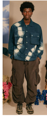
〈그림 8〉 Story MFG 2020 F/W