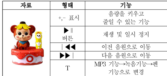
Table 1. Research data and function