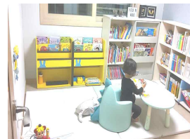
그림 1. 영아의 읽기 놀이 모습 Figure 1. Infant's reading play

연구 환경은 그림1에 보인바와 같이 정우의 도서방은 중문을 열고 들어와 왼쪽으로 가면 방이 2개 있는 구조에 위치 해있는 곳으로 오른쪽에는 도서방, 앞쪽에는 놀이방으로 바로 옆방에 붙어 있는 구조이다. 그 중에 도서 방은 창문이 있는 쪽에 책장이 배치되어 있어 눈이 부시지 않은 정도의 채광이 비치고 있다. 책을 놓는 책장은 ‘ㄱ’ 형태로 구성이 되어있으며 왼쪽부터 시작하여 똑같은 모양의 전면책장이 2개, 그 옆으로 슬라이드 전면책장, 책장이 배치되어 있다. 또 한 책장은 출입문에서 바로 들어가면서 영아가 책을 바라보고 스스로 선택할 수 있는 위치에 배치하였으며, 책은 자유롭게 선택하고 편하게 앉아서 볼 수 있도록 매트와 깔고 더불어 앉는 의자와 책상을 준비해주어, 책을 볼 수 있는 환경을 제공하였다.