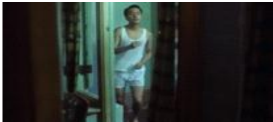
그림 3 드라마 <아비정전>의 한 장면 Figure 3. A scene in a drama <Days of being wild>.

보여주며, 몽환적인 분위기와 취생몽사(醉生夢死)의 감정을 성공적으로 전달한다. 여기서 취생몽사는 중국어로 '취한 것처럼 살고 꿈꾸는 것처럼 죽는다'는 뜻의 사자성어이다. 이 표현은 일상에서 벗어나 현실에서 벗어난 듯 한 무의미하거나 현실 도피적인 삶을 의미한다. 일반적으로 취생몽사는 현실과 떨어진 인생을 살거나 무관심한 태도로 인해 삶의 목표를 잃어버린 사람들을 표현하는 데 사용된다. 이 표현은 또한 삶에서 중요한 가치를 놓친 사람들이나 일상의 고통에서 벗어나기 위해 꿈이나 환상에 기대는 사람들에게도 적용될 수 있다. 따라서 왕가위 감독은 이러한 개인 공간의 개념적 측면을 활용하여 영화 속 인물들의 내면세계와 그들 간의 복잡한 관계를 효과적으로 표현하였다. 이를 통해 각 개인 공간이 인물들의 정서적 연결망을 구축하는데 중요한 역할을 하는 것을 확인할 수 있다. 이는 왕가위 감독의 창작성을 증명하는 동시에, 영화 속 공간이 어떻게 감정과 내면세계를 효과적으로 전달할 수 있는지에 대한 통찰력을 제공한다.