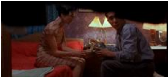
그림 4 드라마 <화양연화>의 한 장면 Figure 4. A scene in a drama <In The Mood For Love>.