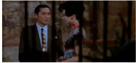
그림 1. 드라마 <화양연화>의 한 장면 Figure 1. A scene in a drama <In The Mood For Love>.

1994년 영화 <중경삼림>에 나온 충칭빌딩(Chungking Mansions)은 영화에서 주요 촬영지 중 하나였으며, 이 빌딩은 복잡한 공공공간으로서 이 영화에서 중요한 역할을 한다. 또한 충칭빌딩은 홍콩에서 가장 변화한 지역 중 하나인 홍콩 네이션거리(Nathan