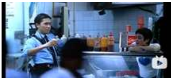
그림 2 드라마 <충칭삼림>의 한 장면 Figure 2. A scene in a drama <Chungking Express>.

지무가 홍콩의 변화하고 시끌벅적한 거리를 질주하는데 다국적 사람들이 그와 어깨를 스치고 지나간다. 거리엔 뻑뻑한 광고판, 거대한 맥도날드 간판, 다양한 색의 가로등, 24시간 편의점 등이 있다. 이러한 요소들은 홍콩이라는 도시의 변화한 상업 풍경을 보여준다. 관객들은 영화를 통해 홍콩 도시 공공공간의 모습에서 홍콩의 경제 발전을 느낄 수 있다. 반면 변화한 물질적 삶이 사람들의 마음속에 공허함과 외로움을 가져다 줄 수도 있음을 왕가위 영화를 통해 알게 된다.