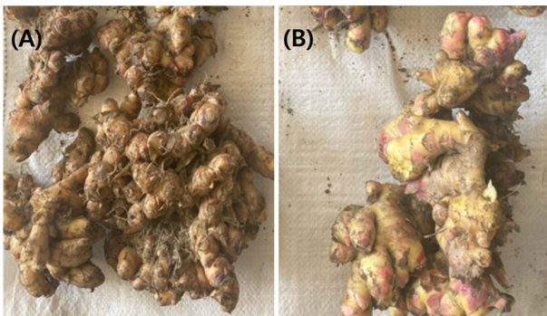
Fig. 1. Korean conventional seed ginger (A) and Chinese seed ginger (B) was grown in Jellabuk-do Wanju.

최근까지 생강과 관련된 연구는 서산생강과 중국생강의 성분을 비교 분석한 Dong 17) 의 연구가 일부 보고되어 있을 뿐 종자 간의 주요 성분에 대한 비교 연구는 매우 미약한 수준이다. 오랜 시간 각 지역에서 재배해 온 고유의