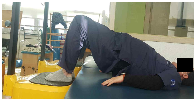
Figure 1. vibration with bridge exercise

진동 교각 운동군의 운동을 위해 소닉스 진동기(SW-VH11, SONIX, KOREA, 2015)를 이용하여 30mm의 강도와 13Hz 주파수를 이용하였다. 운동방법은 교각운동을 하면서 발바닥에 진동이 적용될 수 있도록 바닥에 매트를 진동 발판 높이까지 깔아 수평을 맞추고 바로 누워 무릎관절은 90°, 굽힘 엉덩관절 45° 굽힘을 하고 양발은 20cm 벌림(Cha 등, 2017)을 하여 진동기 발판에 발을 위치하게 하여 시작과 동시에 엉덩관절 펴면서 운동을 하였다(Figure 1). 전통 교각 운동군은 바닥면에서 진동 적용 없이 하였고 진동 교각운동군 자세와 동일하게 적용하였다. 모든 운동은 5분간 트레드밀 위에서 3km/h 속도로 준비운동을 하였고, 본 운동으로 진동기 위에서 15초간 교각 운동 후 10초 휴식을 제공하여 총 30회의 운동을 하였으며, 마무리 운동으로 스트레칭을 5분간 하였다. 운동을 총 6주간 주 3회, 하루 30분씩 중재를 하였다.