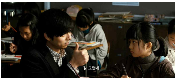
그림 5. 영화 <도가니>의 청각장애 인물 Figure 5.The deaf character in the movie<Silenced>

피해자인 청각장애자는 <도가니>에서 주요 인물이다. <도가니>에 묘사된 ‘청각장애’ 인물은 듣지 못하는 점에서 부족함이 있으나, 다른 사람에게 찾아볼 수 없는 선량함과 진실함을 가지고 있다. 그러나 이러한 이유로 인해 약자의 위치에 놓이게 된다. 즉, 다른 사람보다 순수하고 진실하지만, 불공정한 대우를 받는 희생양으로써 현대 사회의 현실을 상징적으로 묘사, 비판하고 있다. 청각장애라는 개념적 표상이 실질적으로 경쟁 사회 속에서 약자라는 실제적 의미를 내재하고 있는 것이다.