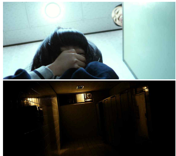
그림 4. 영화 <도가니>의 화장실 공간 Figure 4. The bathroom space of the movie <Silenced>

<도가니>에서 교장은 화장실에서 학생을 성폭행하는데, 화장실까지 향하는 복도의 어두운 조명, 화장실의 음침한 환경과 유난히 대비되는 밝은 조명은 피해자의 심리적 억압, 어두운 감정, 두려움을 부각시키면서 사건에 주목하도록 한다. 일반적으로 화장실은 지저분하고 편안하지 않은 장소라는 이미지를 가지는데, 이 영화에서는 자신의 비밀을 숨기고, 교장의 악한 내면을 감추기 위한 공간으로 표현되었다. 즉, 자신의 진실된 모습이 투영된 공간이기에 어두운 환경으로 묘사되고 있다. 화장실의 공간 이미지는 몽타주 기법을 통해 분위기를 표현하며, 화면공간을 기반으로 서사를 전개하고 있다는 점에서 구조 기호학적 특징을 가지고 있다.