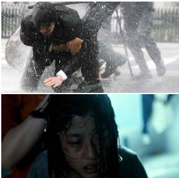
그림 7 영화 <도가니> 속 물 Figure 7. The water in the movie <Silenced>

‘물’의 의미를 크게 세 가지 관점에서 살펴볼 수 있는데, 먼저 정화와 세척의 의미이다. <도가니>에서 물은 피해자들이 겪은 끔찍한 경험과 상처를 씻어내고자 희망하는 시도의 상징이다. 피해자들은 물을 통해 자신들의 몸과 마음을 되돌려 피해자로서의 고통을 잊고, 자존감을 상징적으로 회복하고자 한다.