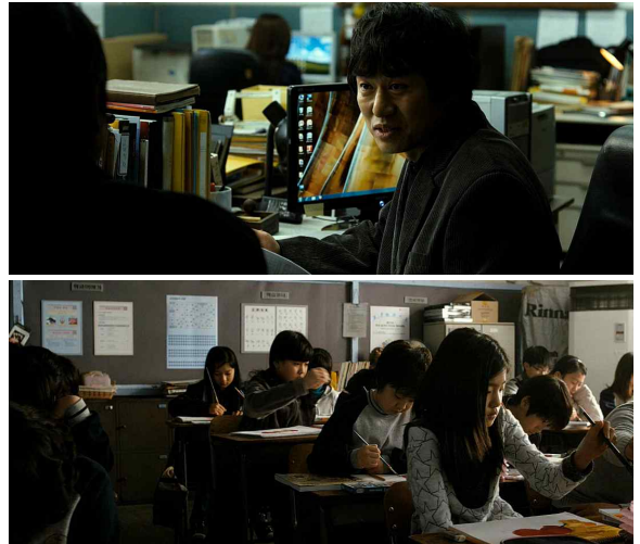
그림 6. 영화 <도가니> 속 학교 Figure 6.The school in the movie <Silenced>

일반적으로 학교는 신뢰의 이미지이지만, <도가니>에서는 기존의 인식과는 다르게 어두운 면을 부각하고 있다. 학교는 지식과 교육을 전달하는 곳으로서 학생들의 안전과 성장을 도모하는 공간이다. 부모와 사회는 학교에 대해 신뢰감을 가지는 이유이다.