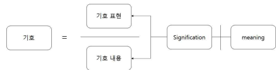
그림 3. 기호학적 의미전달 체계 Figure 3. Semiotic semantic system

의가 필연적이거나 자연적인 ‘동기’가 아닌 ‘사회문화적 관습’에 의해 만들어지는 개념으로 본다는 것이다. 소쉬르의 기호를 기호 표현 및 기호 내용의 두 요소가 결합한 상호작용의 의미라고 보았고, 여기서 기호 표현 (Signifier)은 물리적 실체를 의미하는 영상, 글자, 소리 등이 해당된다. 반면, 기호내용(Signified)은 기호가 대변하는 정신적 개념을 의미하는 것으로, 의미의 운반체이다. 이러한 개념을 바탕으로 의미의 전달체계는 <그림 3>과 같다.