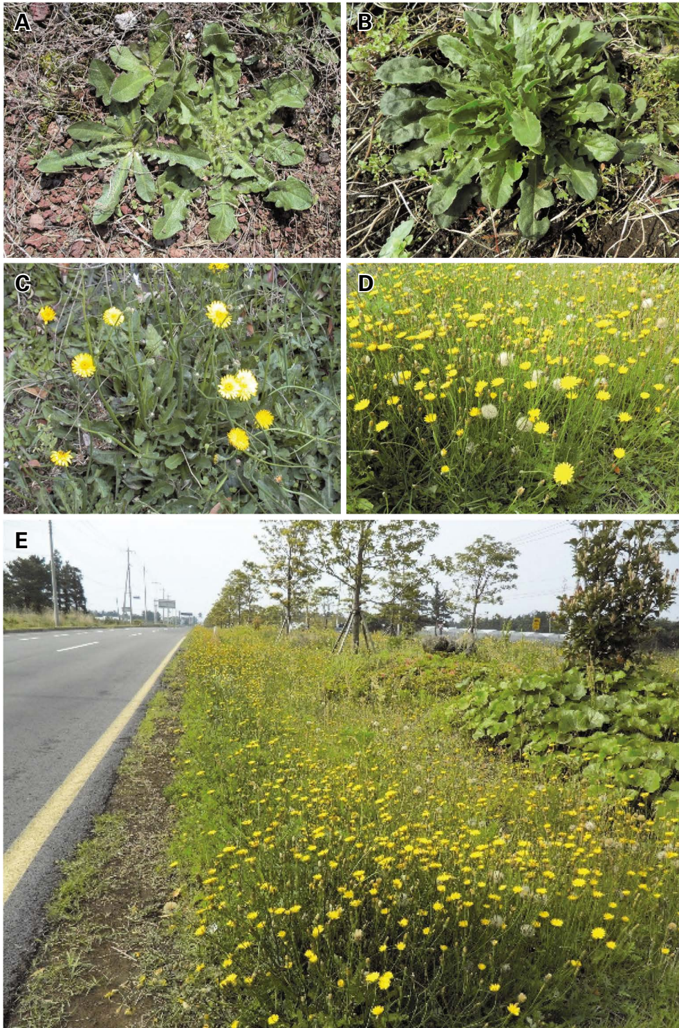
Fig. S1. Morphological characteristics of Hypochaeris radicata . (A) early growth, (B) middle of growth, (C) early flowering, (D) peak flowering period and community, and (E) H. radicata on the roadside of Jeju Island.