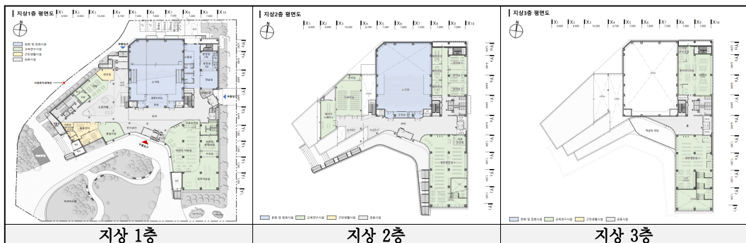
〈그림 2〉 양평물빛정원도서관 주요 공간 조사 및 분석(양평군, 2023)

이를 위해 도서관 사례 분석 기준을 수립하고자 하였다. 공공도서관의 전국 어린이도서관·어린이 서비스 우수사례 및 아이디 공모전,