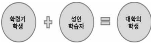
그림 2. 학습자의 변화 Figure 2. Learner change

학령인구 감소 및 평생학습 시대를 맞아 현재 대학은 평생교육관련 사업을 통해 성인학습자를 모집하고 있는 추세이다. 그림 2와 같이 20대 중심의 연령대에서 중장년층의 연령대로 확대된 것은 사업의 성과이며 대학 학습자의 변화이다. 따라서 성인학습자에게 맞는 교육과정개발과 교수학습 방법이 요구되고 있다.